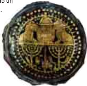
Yahudilerin Muharref Tevrat kaynaklı sembolleri birarada: Şaha kalkmış aslan ve yedi kollu şamdan.

Kenan diyarında kalan Hz. İshak'ın oğlu Hz. Yakup ise, oğulları ile birlikte Mısır'a göç etmiştir. Hz. Yakub'un bir diğer ismi “İsrail”dir ve bu nedenle oğulları aynı zamanda İsrailoğulları olarak anılır. Bilindiği gibi, İsrailoğulları Yahudi toplumunun bir diğer adıdır. Yahudiler, Hz. Yakub'un oğlu olan Hz. Yusuf'un iktidarı boyunca Mısır'da huzur ve güvenlik içinde yaşamış, çok büyük nimetlere sahip olmuşlardır. Ancak Hz. Yusuf'un ardından Yahudiler için, zorlu bir dönem başlamıştır. Putperest Firavun rejimi esnasında Yahudiler Mısır'da köle ko-