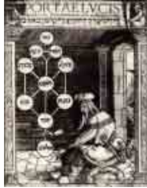
Ortaçağ Yahudi Kabalacılarını gösteren ünlü bir gravür.

dışı bir hareket olan Siyonizm ortaya çıktığında ve Yahudiler için dini bir umut olan "Kudüs'e dönüş" ülküsünü din dışı ve siyasi bir hedef haline getirdiğinde, Kabalacı hahamlar bu projeye destek vermişlerdir. Siyonizme destek veren az sayıdaki dini liderden biri olan Haham Avraham Yitzhak Hacohen Kook, ünlü bir Kalabacı'dır