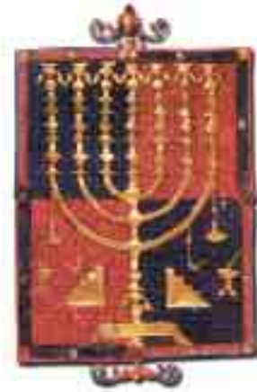
Kabala'da kullanılan Sefirot şemalarından biri.

ve Siyonizmi Mesih'in gelişinin insan eliyle hızlandırılması olarak tanımlamıştır. (Buna karşılık pek çok Yahudi ise bunu bir "sekülerleşme" olarak görmüşlerdir ve bunda haklıdır. Bu gün de Siyonizme karşı çıkan dindar Yahudiler, söz konusu "sekülerleşmeyi" reddedendir.)