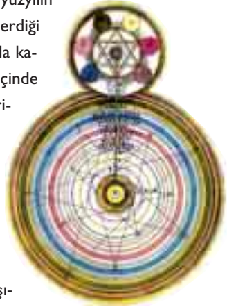
Şeytan Lucifer'in etki alanını gösteren Kabalistik şema

“Hiç şüphesiz, Biz herşeyi kader ile yarattık” (Kamer Suresi, 49) ayetinde de buyurulduğu gibi, Allah tüm evreni ve insanlığı belirlenmiş bir kader ile yarat-