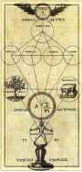
Kabala'nın en temel öğretisi olan Sefirot pek çok büyüsel sembolde de kullanılır.

cesi putperest dönemden geldiğini göstermektedir. Eski Mısır yazıtları üzerindeki semboller dikkatli bir gözle incelendiğinde Kabalistik semboller ile benzerlikleri dikkati çekmektedir.